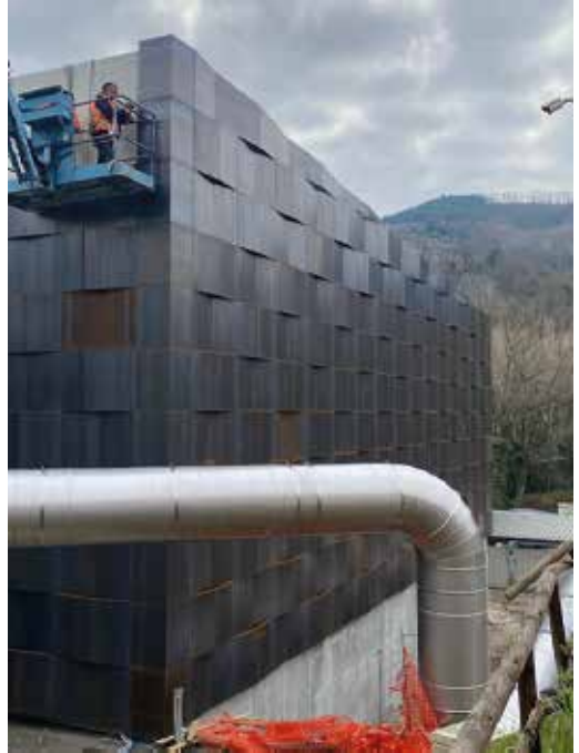
ARCHITECTURAL WALL IN CORTEN PERUGIA