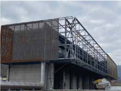
CLADDING OF EXISTING BUILDING IN PERFORATED CORTEN SHEET METAL