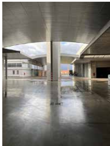
TERMOPLAST FACTORY BUILDING IN FIRENZE