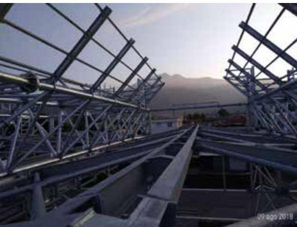
SPORTS HALL IN MASSA