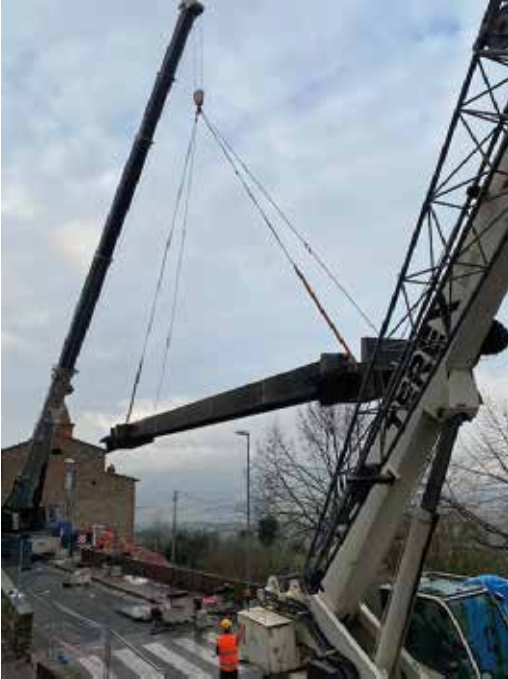
LAUNCH OF THE BRIDGE IN CORTEN CITTÀ DELLA PIEVE